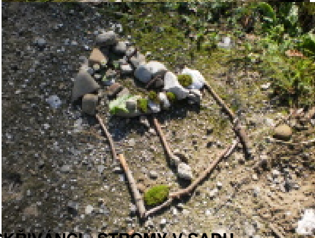
SKRIVANCI - STROMY V SADU