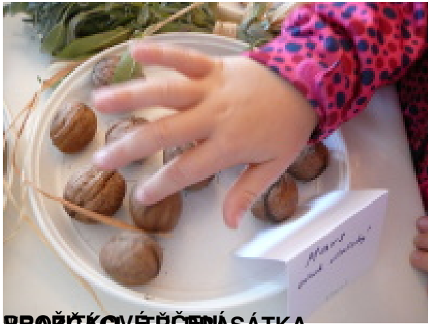
PROŽITKOVÉ PŘEDNÍ SÁTKA